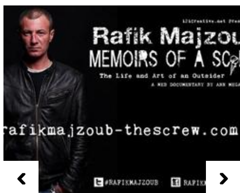
Documental "Memoirs of a screw"